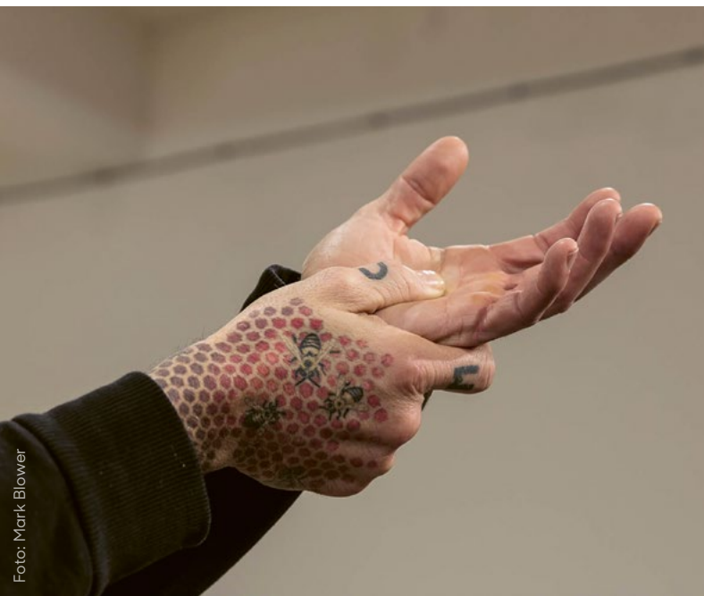
»The Tremble«, part of »The tremble, the symptom, the swell and the hole together«, 2017. Performance at Chisenhale Gallery, London, 2017.

Auch das »ATELIER NO. 70« zeigt wieder künstlerische Beiträge, die sich zwischen offenen Prozessen und konkreten Vorschlägen bewegen.